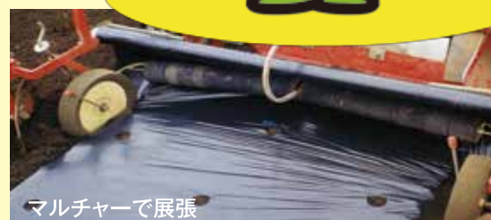
マルチャーで展張